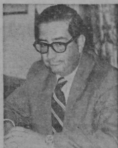
DON FERNANDO BATALLA Vuelve a su Ministerio